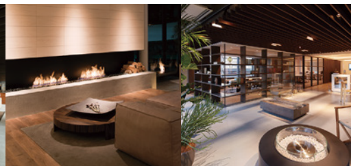
EcoSmart Fire MinamiAoyama Showroom